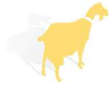
مؤسسة المعمل للفن المعاصر