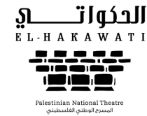
المسرح الوطني الفلسطيني